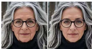
Sensation aus "Höhle der Löwen": Nur eine Anwendung am Abend reduziert...

Vorverkauf/Reservierungen: Kino Katsdorf, T: 0699/11369532, W: http://www.kino-katsdorf.at/ticketreservierung/