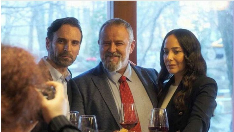
Filmstill "Waterdrop" Foto: Erafilm Albania hochgeladen von Martin Stöbich